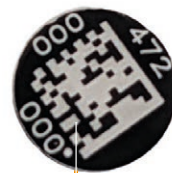
Détecteur MP7 OSL

La quantité de lumière libérée lors de la stimulation optique est directement proportionnelle à la dose de rayonnement.