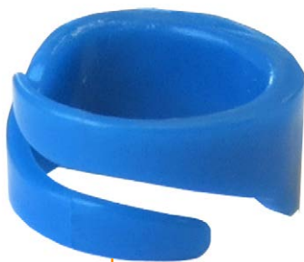
Adaptable à toutes les morphologies