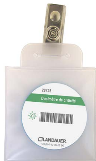
Fig. 1 : Dosimètre de criticité non nominatif sous pochette plastique scellée