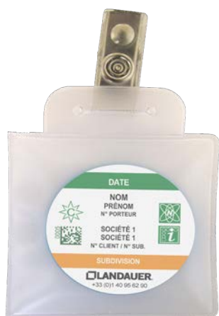
Dosimètre de criticité en conditionnement individuel

Le dosimètre de criticité est utilisé pour mesurer la dose absorbée des travailleurs exposés à des matières nucléaires fissiles - dans les réacteurs, les usines de fabrication et de traitement du combustible... En cas d'accident, il permet de mesurer des doses neutrons élevées supérieures à celle du dosimètre NEUTRAK®.