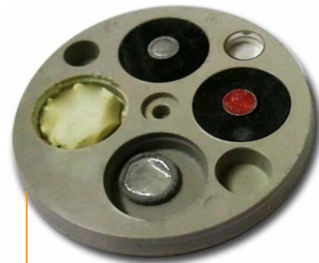
Fig. 2 : Intérieur du dosimètre de criticité Disposition des différentes pastilles

Le port d'un dosimètre de criticité ne dispense pas du port des autres dosimètres (passifs et électroniques). Il vient en complément de ces derniers.